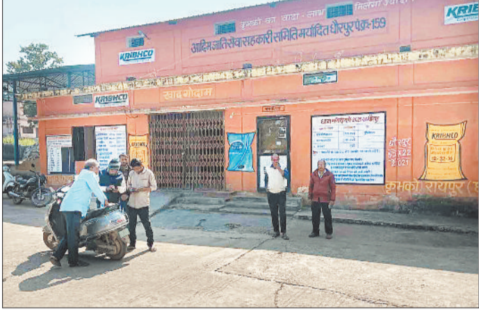
बंद समिति के बाहर खड़े लोग।

बता दें कि 15 नवम्बर से प्रदेशभर में समर्थन मूल्य पर धान खरीदी की प्रक्रिया शुरू कर दी गई है लेकिन इन खरीदी के पहले ही अपनी चार सूत्रीय मांगों को लेकर प्रबंधक, कम्प्यूटर ऑपरेटर अपनी मांगों को लेकर अनिश्चितकालीन हड़ताल पर चले गए हैं। इस हड़ताल के कारण इस बार धान खरीदी के प्रभावित होने की संभावना जताई जा रही थी। हालांकि प्रशासन का दावा था कि समिति प्रबंधक एवं कम्प्यूटर ऑपरेटरों की हड़ताल को देखते हुए जिला प्रशासन ने सभी उपार्जन केंद्रों में नवीन धान खरीदी प्रभारी एवं कम्प्यूटर ऑपरेटरों की नियुक्ति कर दी है। जिससे धान खरीदी कार्य बिना किसी